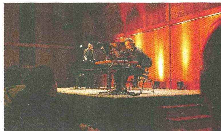
Der Schauspieler aus Berlin las Texte von Bertolt Brecht, Marcel Proust und weiteren Autoren vor.